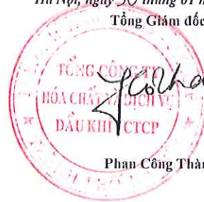
Phan Công Thành