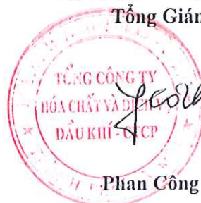
Phan Công Thành